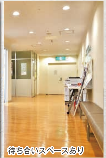
待ち合いスペースあり